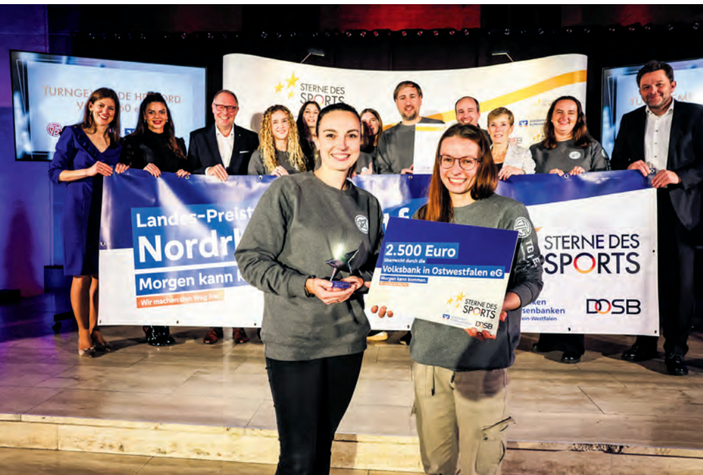
Preisverleihung in Oberhausen: Verdiente Freude bei der Turngemeinde Herford 1860 über den 1. Platz beim Landeswettbewerb »Sterne des Sports« und das Ticket zum Bundesfinale.

Große Anerkennung für die Turngemeinde (TG) Herford 1860: Der mitgliederstärkste Breitensportverein der Hansestadt hat sich gegen zahlreiche Bewerber aus ganz Nordrhein-Westfalen durchgesetzt und den Landesentscheid des Wettbewerbs »Sterne des Sports« gewonnen – am 26. Januar geht es zum Bundesfinale nach Berlin.