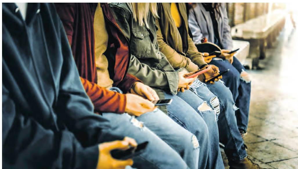
Kino, Konzerte oder Bücher statt Smartphone: Der Kulturpass sollte junge Menschen für unterschiedliche Kulturangebote begeistern und die durch die Pandemie angeschlagene Branche unterstützen – die GenZ war aber kaum interessiert.

Um das virtuelle Budget in Höhe von 200 Euro zu erhalten, mussten die Berechtigten die Kulturpass-App herunterladen und sich registrieren. Über die App konnten dann Eintrittskarten für Veranstaltungen oder Ähnliches gebucht werden – bis das Budget aufgebraucht war. Die jeweiligen Veranstalter, An-