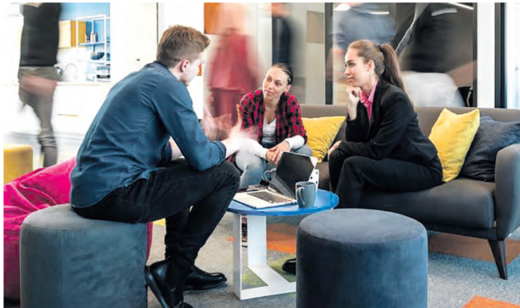
Mit regionalen Stärken gegen den Deutschlandtrend: Trotz schwacher deutscher Gesamtwirtschaft ist die Zahl junger Gründerinnen und Gründer in OWL um sechs Prozent auf 340 Jungunternehmen gestiegen.

Wenig verwunderlich wird der in OWL seit jeher fest veran-