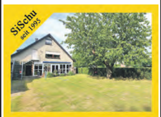
Zweifamilienhaus in idyllischer Sackgassenlage direkt am Fluss

Zentral gelegen und trotzdem am Rande der Natur begeistert das großzügige Wohnhaus, welches in den 1980er Jahren um einen Anbau erweitert wurde mit einer Wohnfläche von ca. 240 m² mit eigenem Gästebereich, Wintergarten mit Billardtisch und sonniger Südterrasse mit elektr. Markise. Optional kann das idyllische 1.017 m² Grundstück um ein ca. 700 m² großes Gartengrundstück erweitert werden. Wichtige Zukunftsweichen wurden schon gestellt (Glasfaseranschluss, Heizung mit Nahwärme, Wasserenthärtung, neues Badezimmer im 1.OG). Die hervorragende Kombination aus guter Infrastruktur und naturnaher Lage direkt am Fluss lässt Ihre Kaufentscheidung leicht werden.