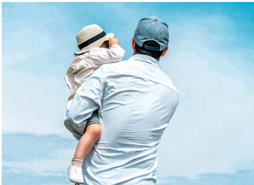
Auf dem Weg zu einem neuen Gleichgewicht: Das Programm „Wir 2“ will Alleinerziehende dabei unterstützen, den Familienalltag besser zu bewältigen und die Beziehung zu ihren Kindern zu stärken.

Die Walter-Blüchert-Stiftung mit Sitz in Gütersloh ist eine