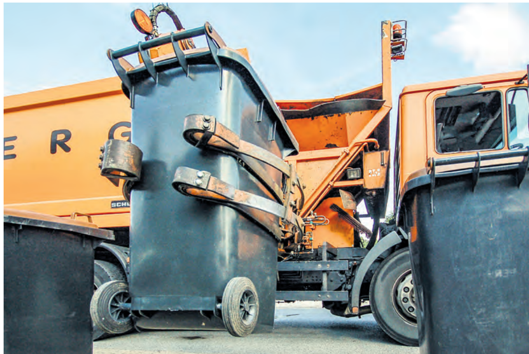
Gegen den Trend: Die Bewohner im Wittekindsland haben 2024 im Pro-Kopf-Vergleich für die geringste Menge an Haushaltsmüll im ganzen Bundesland gesorgt.

Wie Information und Technik Nordrhein-Westfalen als amtliche Statistikstelle des Landes jetzt mitteilt, ergab sich für das vergangene Jahr ein Pro-Kopf-Abfallaufkommen von