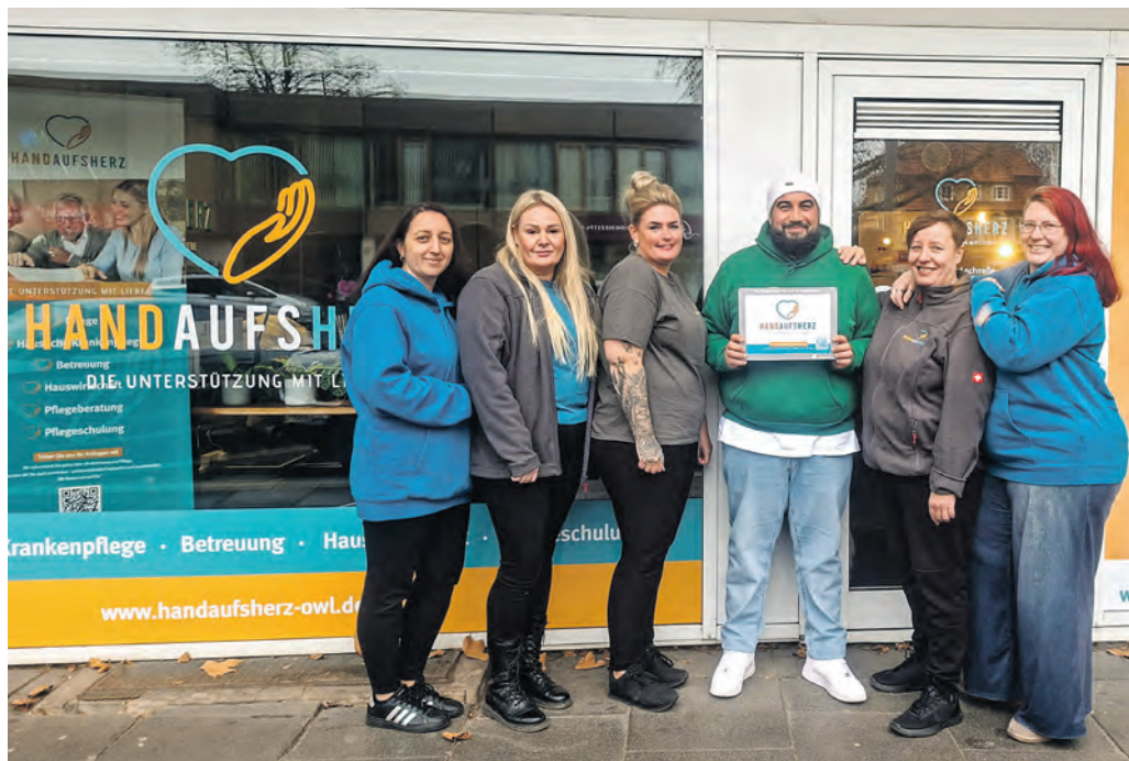
Das Team von »Hand aufs Herz« Herford bietet kompetente Unterstützung mit viel Empathie.

Ihr Wohlbefinden und Ihre Zufriedenheit stehen dabei an erster Stelle. Das Pflegeteam von »Hand aufs Herz« versteht sich als Begleiter auf Ihrem Lebensweg. Die angebotenen Leistungen werden von kompetentem und qualifiziertem Betreuung- und Pflegepersonal durchgeführt. Das Personal nimmt regelmäßig an Schulungen und Fortbildungen teil, um eine durchgehend hohe fachliche Kompetenz zu gewährleisten.