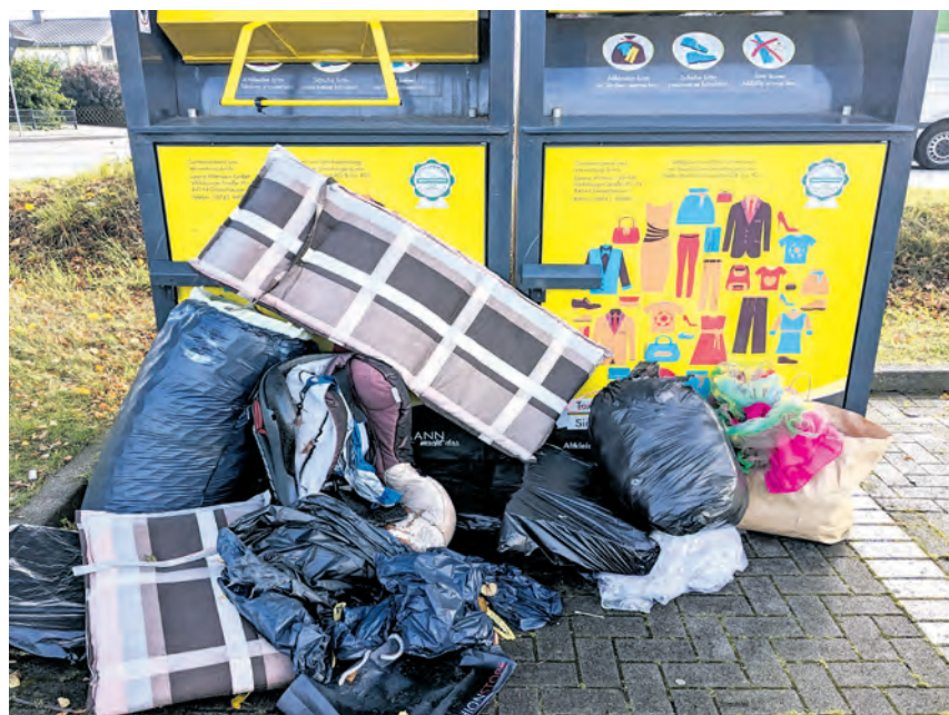
Ein Anblick, wie er im gesamten Kreis Herford leider immer häufiger zu sehen ist. Auch in Löhne verschärft sich die Lage rund um die Altkleidercontainer. Die Hoffnung ruht auf einer bundesweiten Neuregelung bis 2028. (Symbolbild)

Vor diesem Hintergrund befasste sich nun der Stadtrat mit dem Thema. Ein Antrag der AfD-Fraktion brachte verschiedene Maßnahmen zur Diskussion, darunter eine technische Umrüstung der Container. Die Stadt widerspricht jedoch: Die Behälter seien bereits so konstruiert, dass ein Zugriff auf den Inhalt nicht möglich sei. Das Problem entstehe nicht durch das Entnehmen eingeworfener Säcke, sondern durch Beutel, die vor überfüllten Standorten deponiert und dort zerfleddert würden.