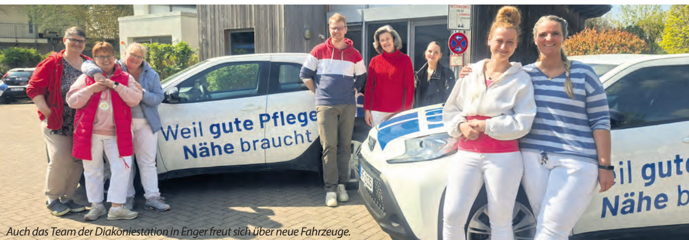
Auch das Team der Diakoniestation in Enger freut sich über neue Fahrzeuge.

Die Diakoniestationen im Kirchenkreis Herford sind täglich für Menschen in Bünde, Enger, Herford, Hiddenhausen, Kirchlengern/Löhne-Nord, Rödinghausen und Spenge im Einsatz.