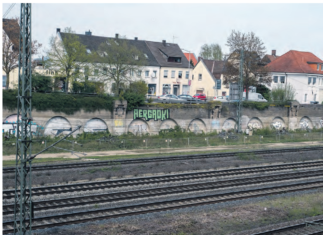
Neuralgischer Standort: Die marode Stützwand befindet sich zwischen zwei wichtigen Verkehrsachsen – der stark frequentierten Oeynhausener Straße und den Bahngleisen.

Starke Abnutzungsspuren, zahlreiche Schmierereien und lediglich symbolisch gesichert durch eine schiefe Bauzaunreihe: Die große Stützwand zwischen den Bahnschienen und der Oeynhausener Straße im Zentrum von Löhne-Bahnhof bietet seit Jahren keinen ansprechenden Anblick. Doch nicht nur optisch ist das Bauwerk in schlechtem Zustand – auch baulich gilt es inzwischen als vollkommen marode.