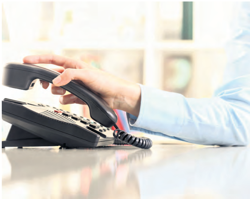
Spam-Anrufe mit angeblichen Gewinnen, penetranter Werbung oder automatischen Bandansagen bleiben für viele Menschen ein wiederkehrendes Ärgernis. Am besten sofort auflegen.

Diese Behörde ist für die Aufsicht über den Telekommunikationsmarkt zuständig und geht gegen unerlaubte Telefonwerbung, Spam-Anrufe und Rufnummernmissbrauch vor. Sie kann Bußgelder verhängen und Rufnummern abschalten, um Täuschung und Belästigung einzudämmen und faire Wettbewerbsbedingungen zu sichern. „Im Jahr 2025 sehen wir wie schon im Vorjahr einen Anstieg der Beschwerdezahlen. Unerlaubte Werbeanrufe schaden massiv und sind zugleich ein ernstes Problem für den Wettbewerb“, sagt Klaus Müller, Präsident der Bundesnetzagentur. „Wir gehen weiter mit Nachdruck