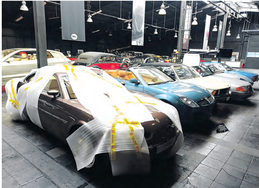
Absolut sehenswert: Auch diese Fahrzeuge sind im Rahmen der Sonderausstellung »Karmann Konzepte – Out of the dark« zu sehen.

Begleitend zur Ausstellung bietet das Automuseum Melle ein umfangreiches Programm an exklusiven Sonderführungen an. Diese ermöglichen den