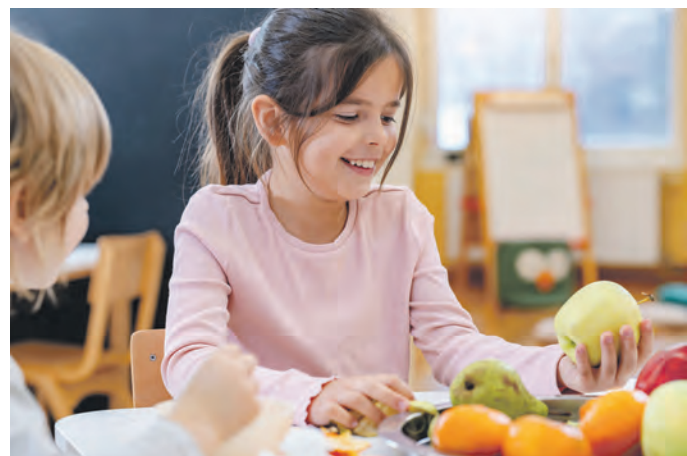
Mitmachen statt nur mitessen: Der Kreis Herford will zukünftig auf aktive Beteiligung der Mädchen und Jungen sowie praktische Ansätze für eine bessere Kitaverpflegung setzen.

Diese Erfahrungen, so die Hoffnung der Projektverantwortlichen, nehmen die Kinder mit nach Hause. So entsteht eine Grundlage für bewusste und verantwortungsvolle Ernährungsentscheidungen im späteren Leben. Damit dies im Alltag gut gelingt, sollen zwei unterschiedliche Fortbildungsformate erprobt werden. Bereits bestehende Angebote von Bund und Land