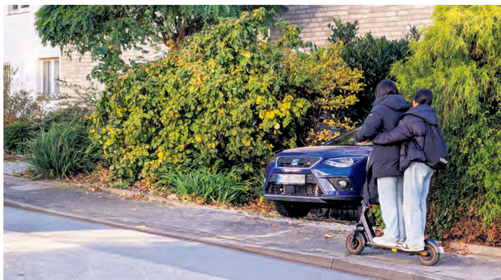
Leider ein alltäglicher Anblick auch im Kreis Herford: Zwei Jugendliche, die unerlaubt auf einem E-Roller fahren und sich und andere gefährden, indem sie die Verkehrsregeln missachten.

Die steigende Anzahl der Unfälle liegt auch an der zunehmenden Verbreitung dieser Gefährte. Allerdings scheinen das Fahrverhalten und die Einstellung zu Verkehrsregeln jeglicher Art sowie die Rücksicht im Straßenverkehr ein generelles Problem bei vielen E-Roller-Fahrern