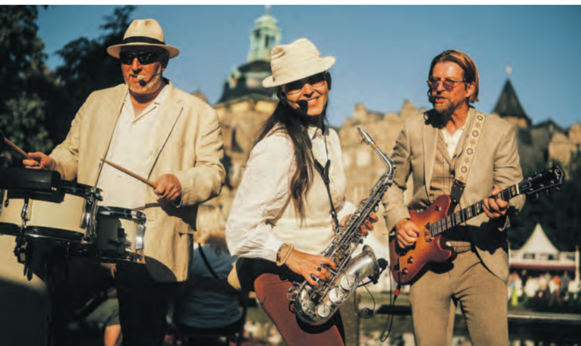
Für gute Unterhaltung sorgt am Abend die Band »Mr. Moonlight«.