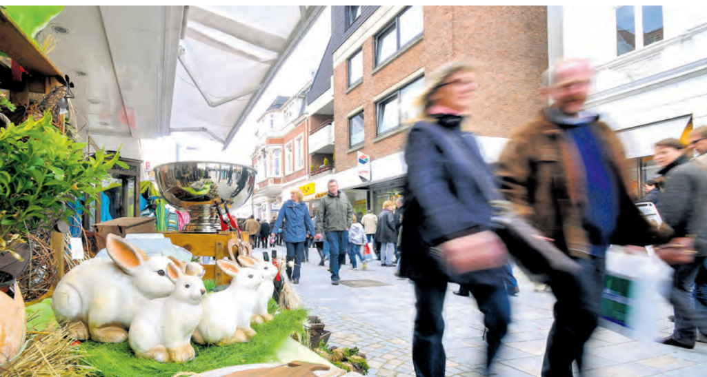
Ein gutes Ostergeschäft könnten die Einzelhändler im Kreis Herford dringend brauchen: Derzeit belastet die anhaltende Kaufzurückhaltung die Umsätze der Läden massiv.

Viele Herausforderungen, geopolitische Unsicherheiten, deutliche Unterschiede zwischen den Branchen und eine Mut machende Tendenz: Das sind einige der Ergebnisse der jüngsten IHK-Konjunkturumfrage unter 268 Betrieben und Unternehmen im Kreis Herford.