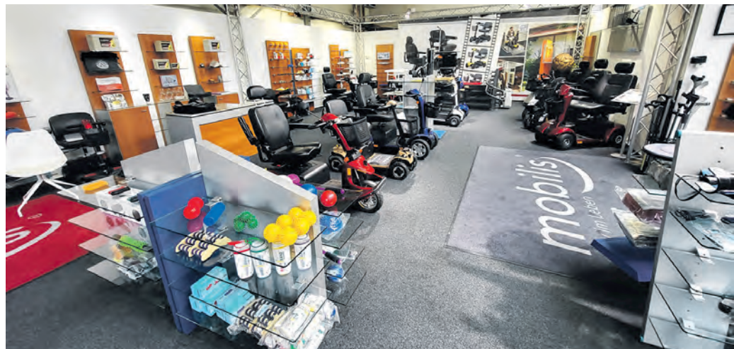
Das Angebot des regionalen Shops von Mobilis in der Daimlerstraße reicht von einfachen Alltagshilfen bis hin zu technisch anspruchsvollen Mobilitätslösungen.

Hilfsmittel spielen eine wichtige Rolle, wenn es darum geht, Selbstständigkeit zu erhalten oder zurückzugewinnen. Schon kleine Anpassungen im Alltag – etwa rutschfeste Badaccessoires oder ergonomisches Besteck – können den Unterschied zwischen Abhängigkeit und eigenständigem Handeln ausmachen. Mobilis setzt daher bewusst auf ein Sortiment, das sowohl einfa-