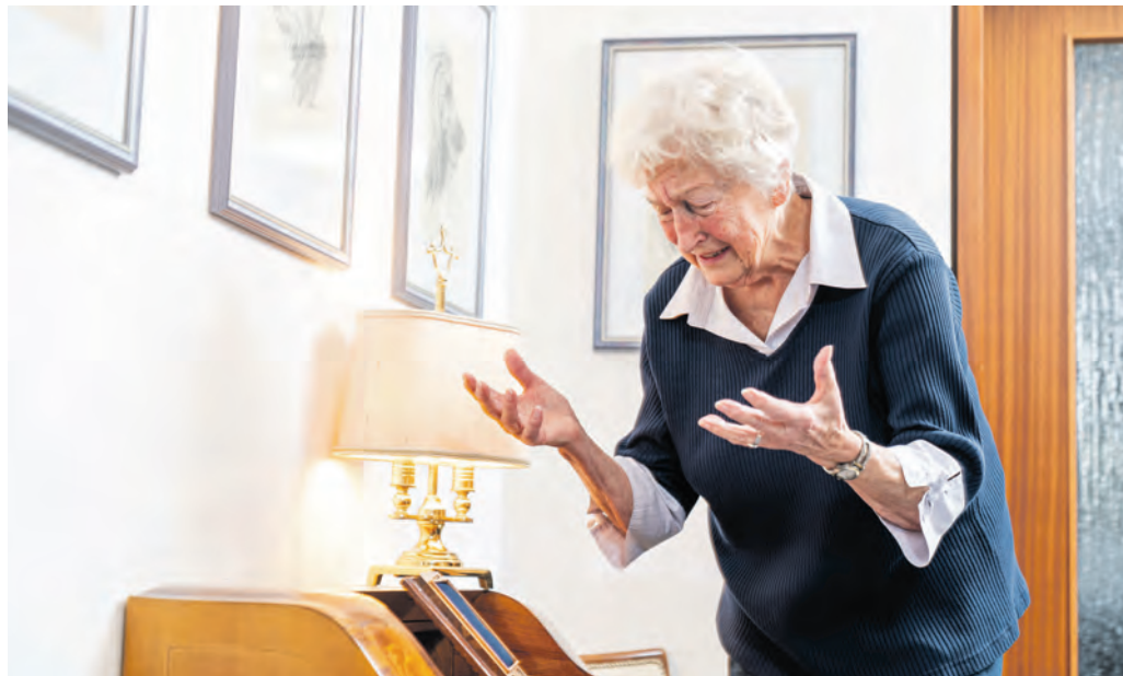
Ob Enkeltrick, Schockanruf oder die jüngste „Heilungsmasche“ in Löhne: Betrüger setzen auf Emotionen und Zeitdruck, um Senioren um ihr Geld oder ihre Wertsachen zu bringen.

Wie die Polizei mitteilt, sprachen zwei bisher unbekannt, etwa 20 und 40 Jahre alte Frauen an einem Samstag gegen 12:00 Uhr eine Seniorin auf dem Parkplatz eines Supermarktes an der Albert-Schweitzer-Straße an. Die russischsprachigen Frauen, beide zwischen 1,60 und 1,65 Meter groß, behaupteten gegenüber der Löhnerin, sie mache einen krassen Eindruck. Ohne mit der Wimper zu zucken, gaben die Betrügerinnen vor, die Frau heilen zu können, schildert die Polizei den mutmaßlichen Tathergang. Um diese Heilung voranzutreiben, benötigten sie jedoch Geld und erkundigten sich nach ihrem Vermögen. Die Seniorin gab an, eine mittlere fünfstellende Summe Bargeld im Haus zu haben, holte den Betrag und übergab ihn den Frauen. Im Gegenzug erhielt sie ein Päckchen, das sie erst nach einigen Tagen öffnen sollte. Zu Hause schöpfte die Frau jedoch Ver-