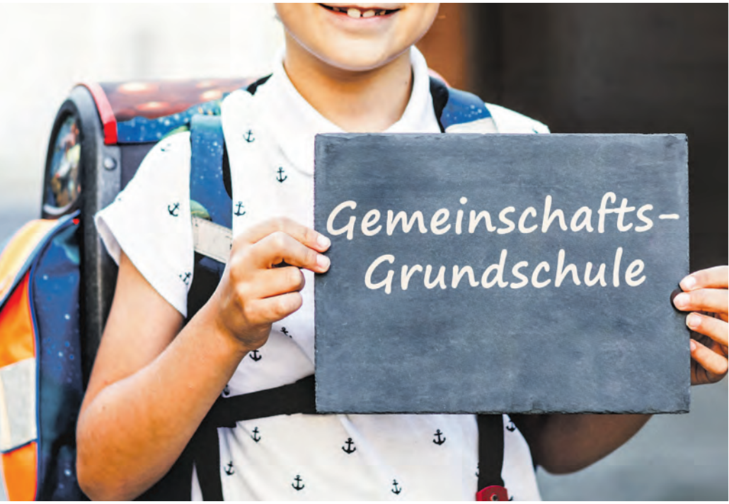
Mit einem deutlichen Votum an allen sechs betroffenen Standorten haben die Eltern den Weg für ein einheitliches und konfessionsloses Grundschulsystem in Löhne gebtet.

Nach langen und teils auch kontroversen Diskussionen, politischem Taktieren und einer aufwendigen Elternbefragung hat sich der Geist der Aufklärung schließlich durchgesetzt: Zum neuen Schuljahr werden die bisherigen evangelischen Bekenntnisschulen in Gemeinschaftsgrundschulen umgewandelt. Somit werden nach den Sommerferien alle sieben Löhner Grundschulen konfessionslos sein.