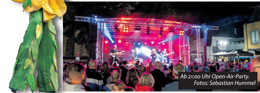
Ab 21:00 Uhr Open-Air-Party.

Am Abend folgt ab 21 Uhr eine Open-Air-Party auf dem Rathausplatz mit Live-Musik der Band Steplight und DJ stöbi.