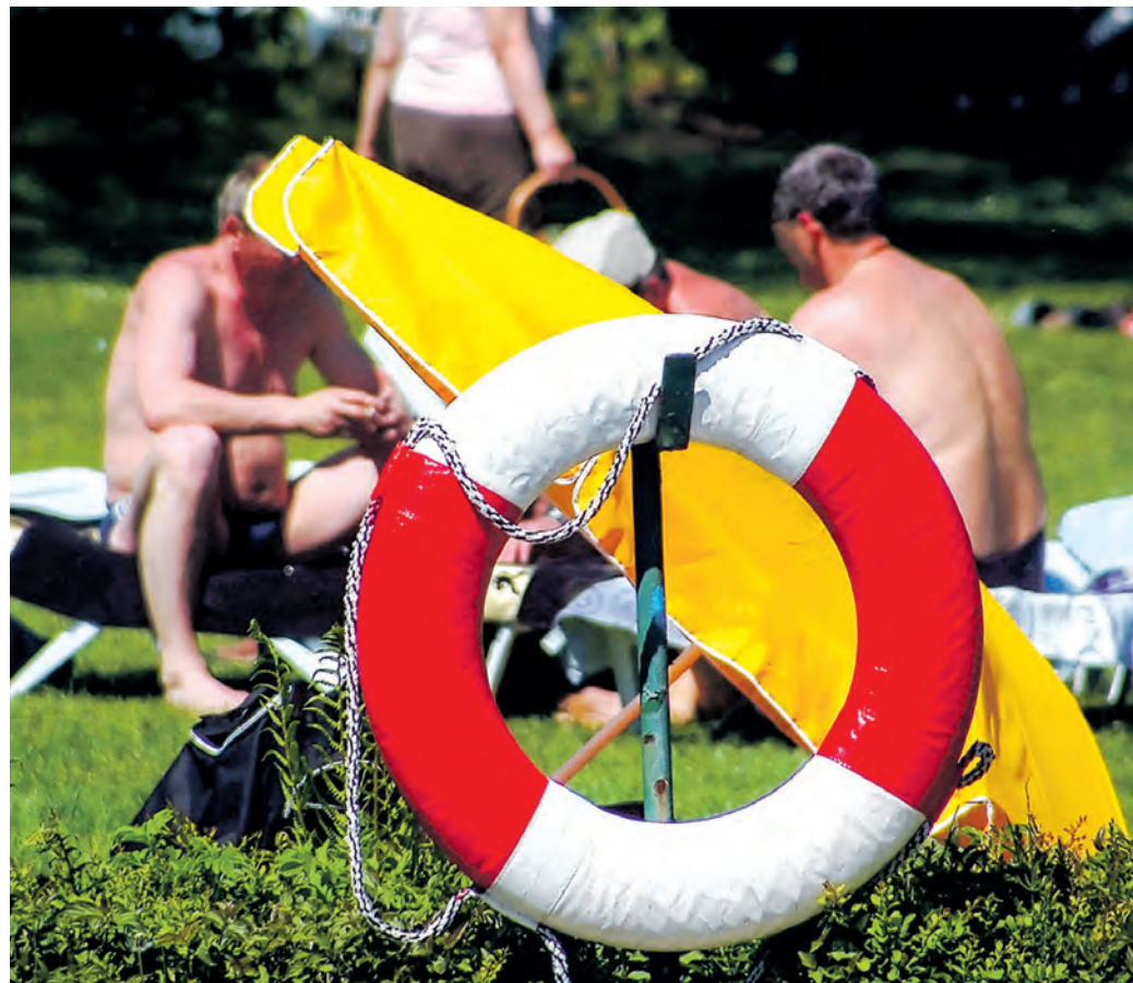
Beliebte Freizeiteinrichtung: Im Jahr 2025 wurden im Werburger Waldbad rund 17.500 Eintrittskarten verkauft und insgesamt rund 55.000 Besucher gezählt.

Nach dem wechselhaften Frühjahr hoffen viele Menschen auf schönere Tage und freuen sich auf Freibadbesuche bei milden Temperaturen. Und das vielleicht schon am ersten Mai-Wochenende, wenn das Werburger Waldbad voraussichtlich in die Saison startet. Kleiner Wermutstropfen: Die Eintrittspreise fallen in diesem Jahr höher aus.