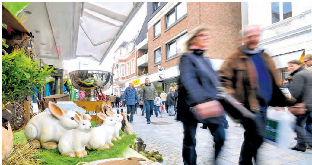
Ein gutes Ostergeschäft könnten die Einzelhändler im Kreis Herford dringend brauchen: Derzeit belastet die anhaltende Kaufzurückhaltung die Umsätze der Läden massiv.

Viele Herausforderungen, geopolitische Unsicherheiten, deutliche Unterschiede zwischen den Branchen und eine Mut machende Tendenz: Das sind einige der Ergebnisse der jüngsten IHK-Konjunkturumfrage unter 268 Betrieben und Unternehmen im Kreis Herford.