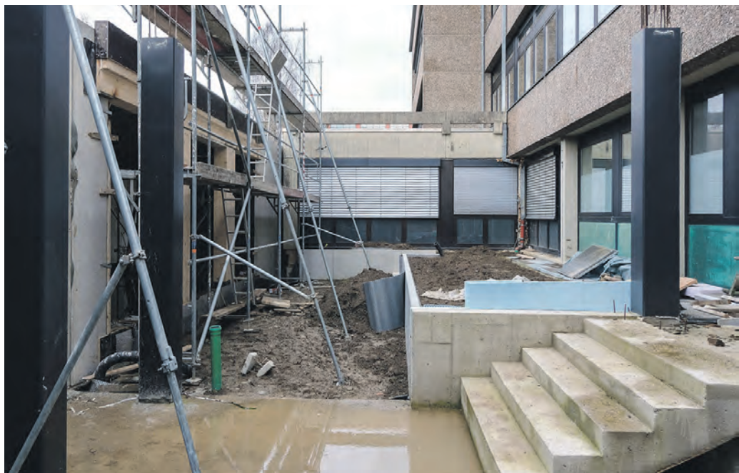
Übergang schon gut zu erahnen: Der dringend benötigte Anbau (links) entsteht direkt am Bestandsgebäude des Gymnasiums mit der charakteristischen Waschbetonfassade (rechts) zur Sattelmeierstraße hin.

Alle Beteiligten dürften froh sein, dass die notwendige Expansion des Widukind-Gymnasiums Enger sichtbar Fahrt aufnimmt. Schließlich wurde lange hin- und hergeplant, bevor der Baustart in diesem Sommer erfolgte. Zudem sitzt den Verantwortlichen ein nicht verschiebbarer Termin im Nacken.