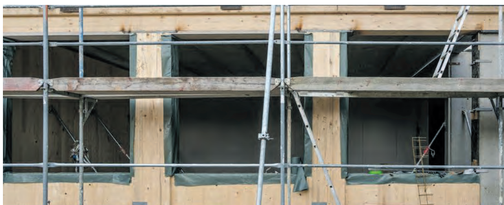
Viel Holz wird verbaut: Treppenhaus, Fahrstuhlschacht sowie stützende Elemente sind aus Beton, die Außenwände des Erdgeschosses sind massive, 15 Zentimeter dicke Holzmodule.

im ersten Stock Sanitäranlagen und im zweiten Obergeschoss barrierefreie Toiletten. Der Flächenzugewinn beläuft sich auf 1.024 Quadratmeter, die die Schule durch die G9-Wiedereinführung dringend benötigt. Das Gebäude wird in Hybridbauweise gefertigt: Treppenhaus, Fahrstuhlschacht sowie stützende Elemente sind aus Beton, die Außenwände des Erdgeschosses sind massive, 15 Zentimeter dicke Holzmodule. Die Obergeschosse werden als Holzrahmenkonstruktionen mit Trockenbaumodulen errichtet. „Wir wollen so nachhaltig wie möglich bauen. Deshalb setzen wir dort, wo es möglich ist, auf Holz“, so Strathmann und kündigt an: „Bis Weihnachten soll der Rohbau stehen und dicht sein, danach kann der Innenausbau witterungsunabhängig vorangetrieben werden.“