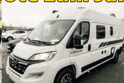
Crosscamp 600 | EZ: 04/2025 | 19.500 km SAT/TV | AHK | Solar | 140 PS | 57.900 €