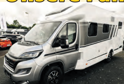
Carado T448 Pro | EZ: 2024 | 7.500 km SAT/TV, Backofen | 180 PS | 69.900 €

Unsere Fahrzeugangebote zum Jahreswechsel