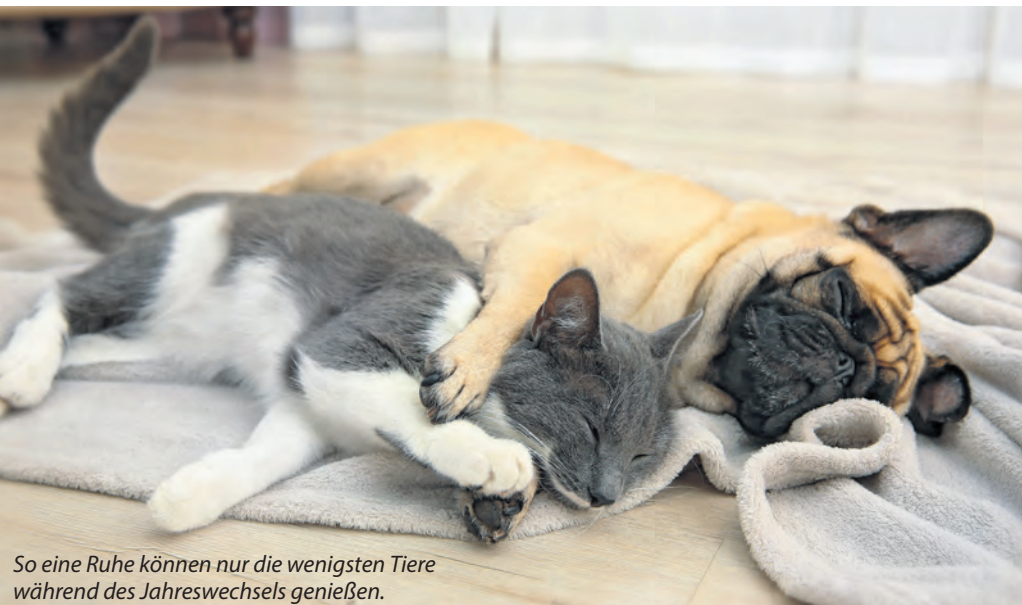
So eine Ruhe können nur die wenigsten Tiere während des Jahreswechsels genießen.

Alle Jahre wieder kommt nach der besinnlichen Weihnachtszeit die laute, böllernde Silvesterzeit. Für viele Tiere ist es nicht nur eine Nacht des Schreckens, sondern auch die Tage vorher und nachher sind Zeiten der Angst. Phobien sind beim Menschen als schwere Angststörungen anerkannte Krankheitsbilder. Bei Tieren werden Symptome der Angst häufig leider immer noch als nicht behandlungsbedürftig bewertet. Manchmal ist auch nicht bekannt, dass Angst auch in der Tiermedizin effektiv und schonend behandelt werden kann und Tierhalter und Tiere durchleiden zum Jahreswechseln gemeinsam eine schlimme Zeit.