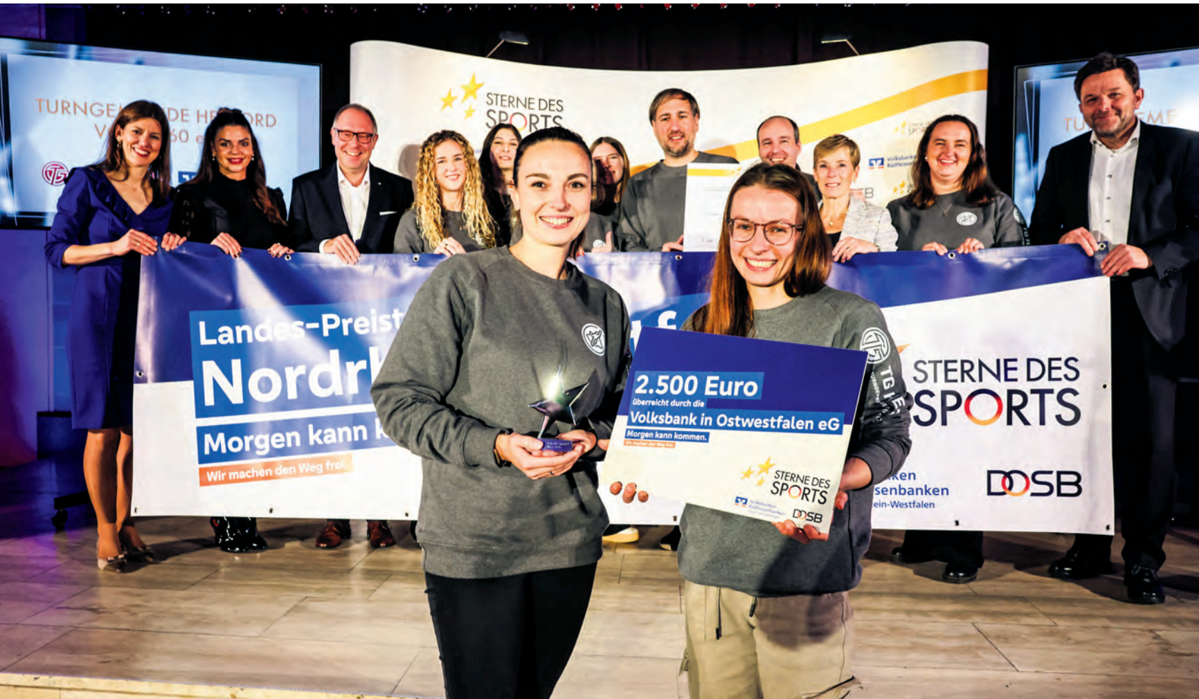
Preisverleihung in Oberhausen: Verdiente Freude bei der Turngemeinde Herford 1860 über den 1. Platz beim Landeswettbewerb »Sterne des Sports« und das Ticket zum Bundesfinale.

Große Anerkennung für die Turngemeinde (TG) Herford 1860: Der mitgliederstärkste Breitensportverein der Hansestadt hat sich gegen zahlreiche Bewerber aus ganz Nordrhein-Westfalen durchgesetzt und den Landesentscheid des Wettbewerbs »Sterne des Sports« gewonnen – am 26. Januar geht es zum Bundesfinale nach Berlin.