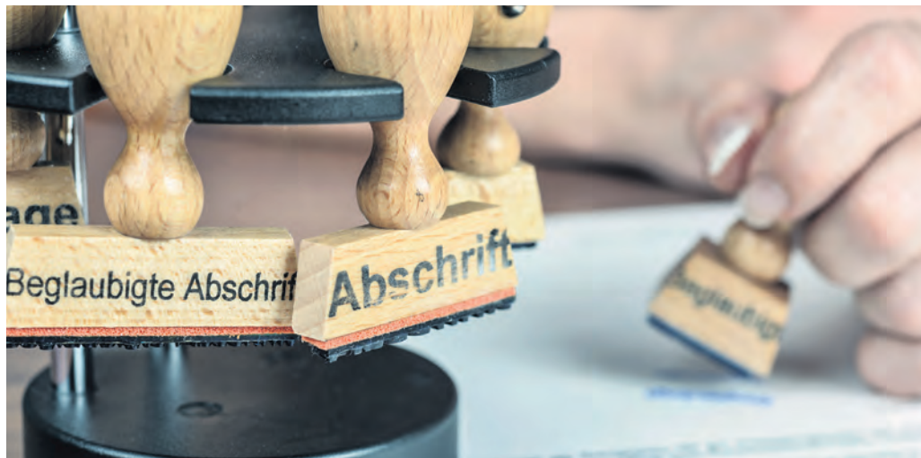
Die hohe Belastung von kleinen und mittleren Unternehmen durch regulatorische und bürokratische Hürden belastet die mittelständisch geprägte Region Ostwestfalen und den Kreis Herford überproportional stark.

Für Uni-Vizepräsident René Fahr ist diese Analyse die Basis für die Steuerung einer nachhaltigen Transformation: „Nur mit einer wissenschaftlich fundierten Grundlage können wegweisende Entscheidungen getroffen werden. Mit der SWOT-Analyse bereiten wir die Ergebnisse handlich und übersichtlich auf.“ Sein Fazit: „OWL hat sehr gute Voraussetzungen – aber auch