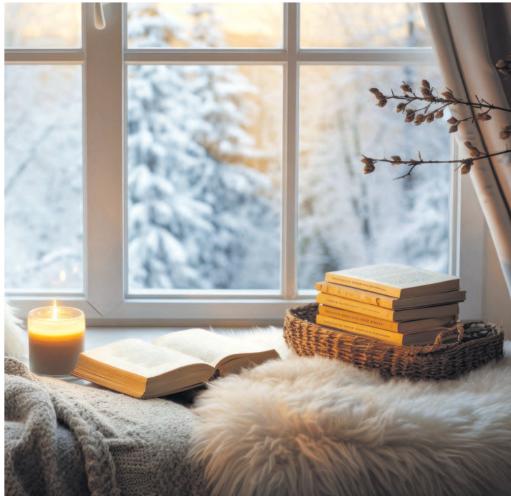
Fachgerecht montierte Qualitätsfenster mit Mehrkammerprofilen und Mehrfachverglasung halten im Winter die Wärme im Haus und im Sommer die Hitze draußen.

Nicht zuletzt um den Heizenergieverbrauch zu senken, werden in vielen älteren Gebäuden Fenster und Haustüren ausgetauscht. Dafür gibt es auch Fördermittel. Aufgrund ihrer hervorragenden Dämmleistung und der dadurch sehr viel dichteren Gebäudehülle rückt auch das Thema Innenraumluft in den Fokus. Verbraucher sollten deshalb mit Blick auf die Wohngesundheit darauf achten, dass die beim Einbau der neuen Fenster und Haustüren verwendeten Dämm- und Dichtstoffe das Emicode-Zeichen tragen.