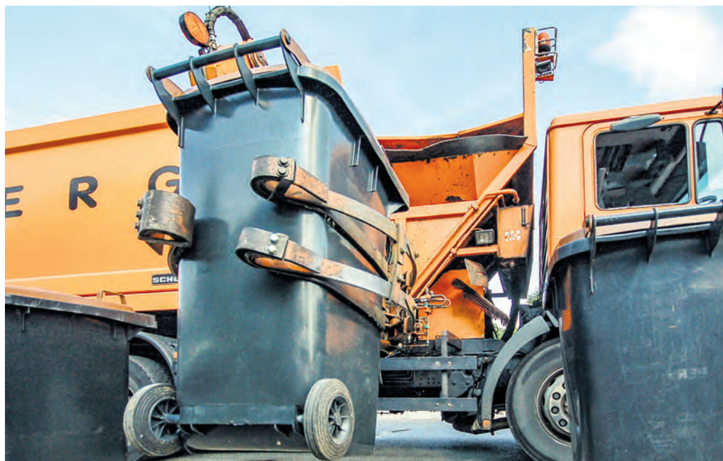
Gegen den Trend: Die Bewohner im Wittekindsland haben 2024 im Pro-Kopf-Vergleich für die geringste Menge an Haushaltsmüll im ganzen Bundesland gesorgt.

Wie Information und Technik Nordrhein-Westfalen als amtliche Statistikstelle des Landes jetzt mitteilt, ergab sich für das vergangene Jahr ein Pro-Kopf-