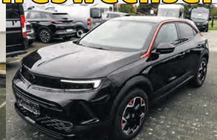
Mokka GS Line | EZ: 2021 | 37.000 km Benzin | Automatik | 21.900 €