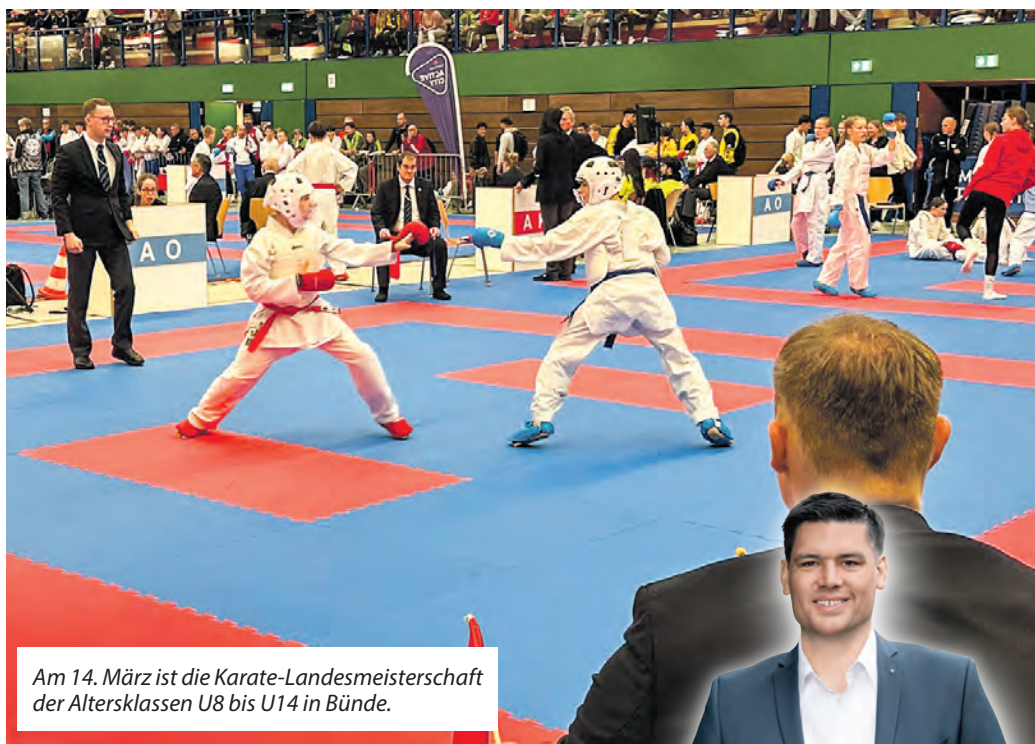
Am 14. März ist die Karate-Landesmeisterschaft der Altersklassen U8 bis U14 in Bünde.

Am Samstag, 14. März 2026, wird die Stadt Bünde zu einem wichtigen Meilenstein der Karatejugend: Rund 400 junge Karateka aus ganz NRW treten hier zur Landesmeisterschaft Kinder & Schüler an – dem bedeutendsten Nachwuchsturnier des Karate-Dachverbandes Nordrhein-Westfalen (KDNW).