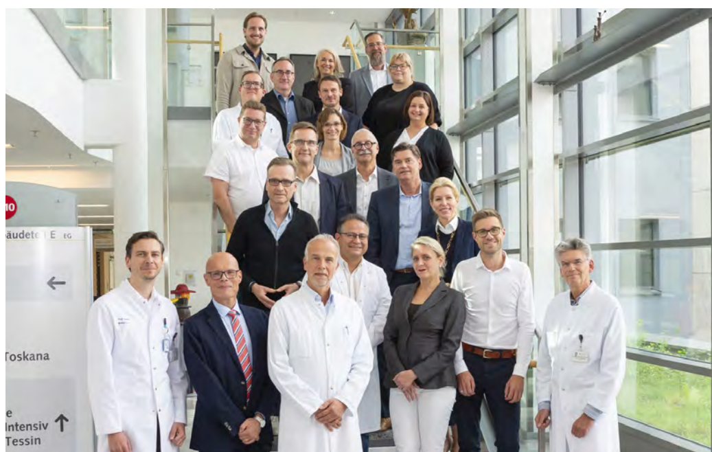
Kompetenzen bündeln: Das Gründungsteam des »Lungenkrebszentrums OWL« aus den Kreiskliniken Herford-Bünde, dem Herz- und Diabeteszentrum NRW in Bad Oeynhausen und dem Klinikum Bielefeld.

In der Region entsteht ein neues medizinisches Bündnis: Die Kreiskliniken Herford-Bünde, das Herz- und Diabeteszentrum (HDZ) NRW in Bad Oeynhausen und das Klinikum Bielefeld werden ein gemeinsames Lungenkrebszentrum an drei Standorten aufbauen. Hauptziel ist es, Patienten künftig schneller und besser zu versorgen.