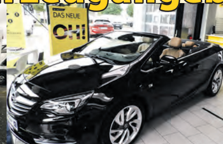
Cascada | EZ: 2015 | 44.200 km 170 PS | Benzin | Automatik | 16.900 €