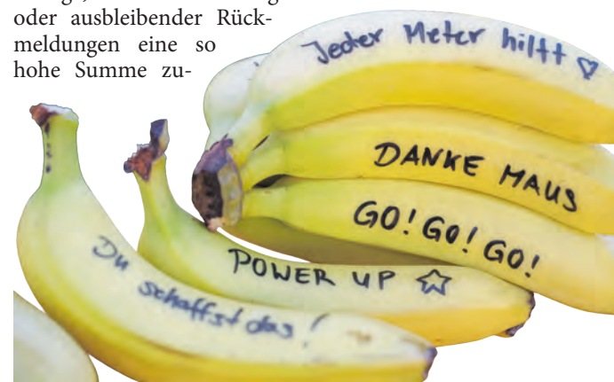
Das Helferteam kümmerte sich hervorragend um die Verpflegung der Läufer, diese gesunden Motivationshilfen verraten viel über die liebevolle Organisation dieses ehrenamtlichen Events.