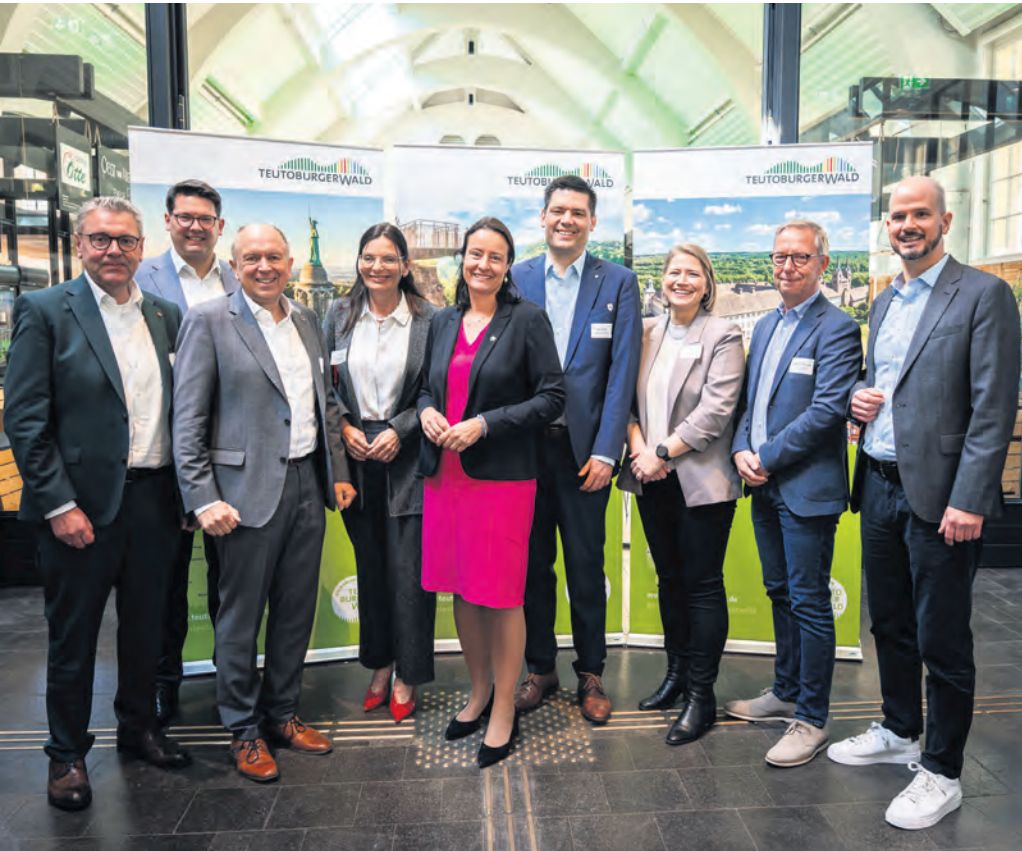
Unter dem Motto „Kompass Zukunft. Tourismus 2030“ haben sich beim 17. Teutoburger-Wald Tourismustag zahlreiche Vertreter aus der Tourismusbranche, der Wirtschaftsförderung, der Politik, der Verwaltung und dem öffentlichen Leben in der Herforder Markthalle ausgetauscht.

Der Tourismus in Deutschland boomt. Viele Menschen erkennen, dass es auch abseits von Nordseeküste, Schwarzwald oder Alpenpanorama eine Menge zu entdecken gibt. Wie viele andere Branchen auch ist der Fremdenverkehr mit vielen Herausforderungen konfrontiert – vieles davon wurde jetzt auf einer großen Fachkonferenz in Herford thematisiert.