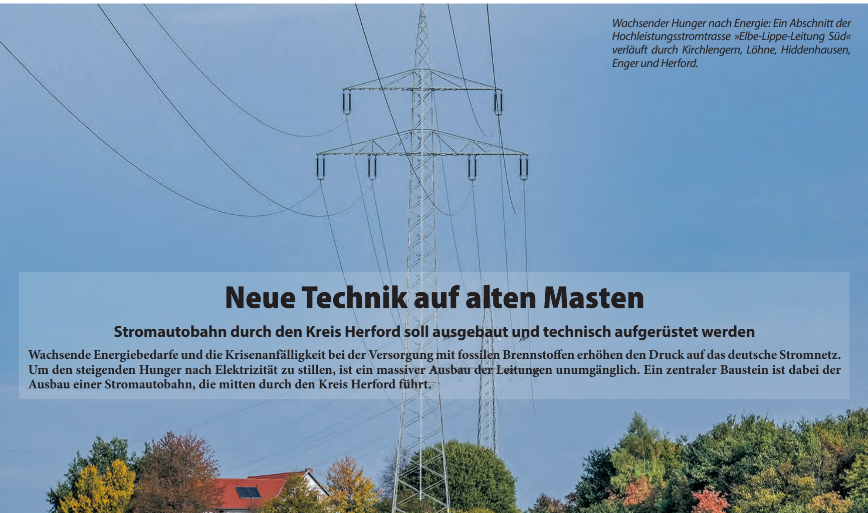
Wachsender Hunger nach Energie: Ein Abschnitt der Hochleistungsstromtrasse »Elbe-Lippe-Leitung Süd« verläuft durch Kirchlengern, Löhne, Hiddenhausen, Enger und Herford.

Öffnungszeiten: Mo. – Do. 8:00 – 16:00 Uhr, Fr. 8:00 – 13:00 Uhr Lange Straße 48 · 32278 Kirchlengern · Tel.: 05223-49 16 47-0 E-Mail: info@gl-treppenlifte.de