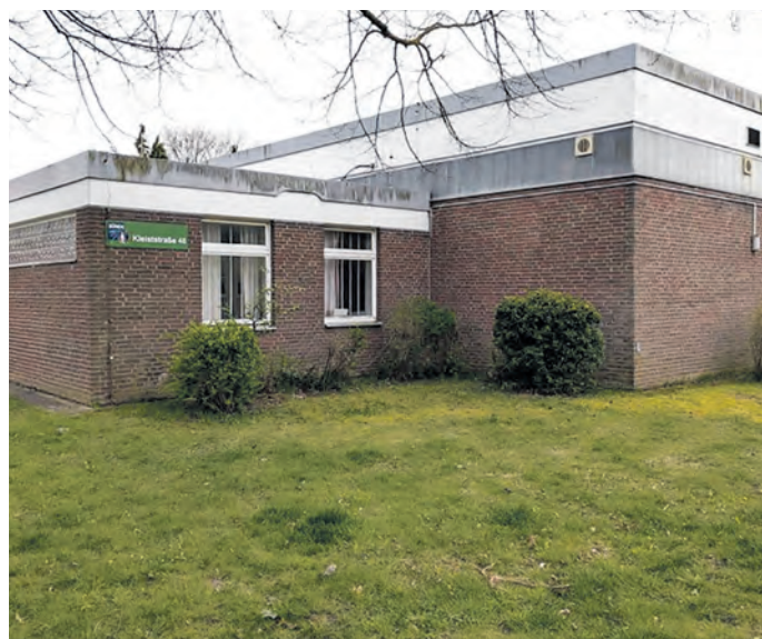
Markantes Gebäude: Der ehemalige NAAFI-Shop (Navy, Army and Air Force Institutes) befindet sich seit einigen Jahren im Besitz der Stadt Bünde.

Mit der Ausgabe von Lebensmitteln an bedürftige Menschen alle 14 Tage erfüllen mehr als 100 Ehrenamtliche der Meller Tafel eine wichtige Aufgabe in der Region. In den vergangenen Jahren hat die Nachfrage infolge zunehmender Krisen und Belastungsfaktoren merklich zugenommen – Tendenz weiter steigend.