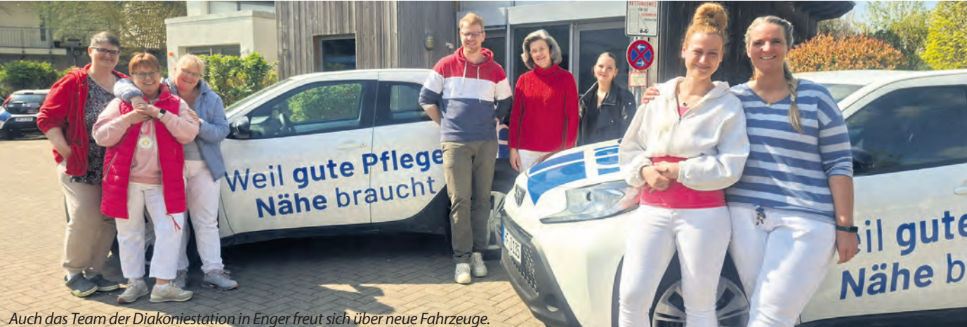
Auch das Team der Diakoniestation in Enger freut sich über neue Fahrzeuge.

Die Diakoniestationen im Kirchenkreis Herford sind täglich für Menschen in Bünde, Enger, Herford, Hiddenhausen, Kirchlengern/Löhne-Nord, Rödinghausen und Spenge im Einsatz.