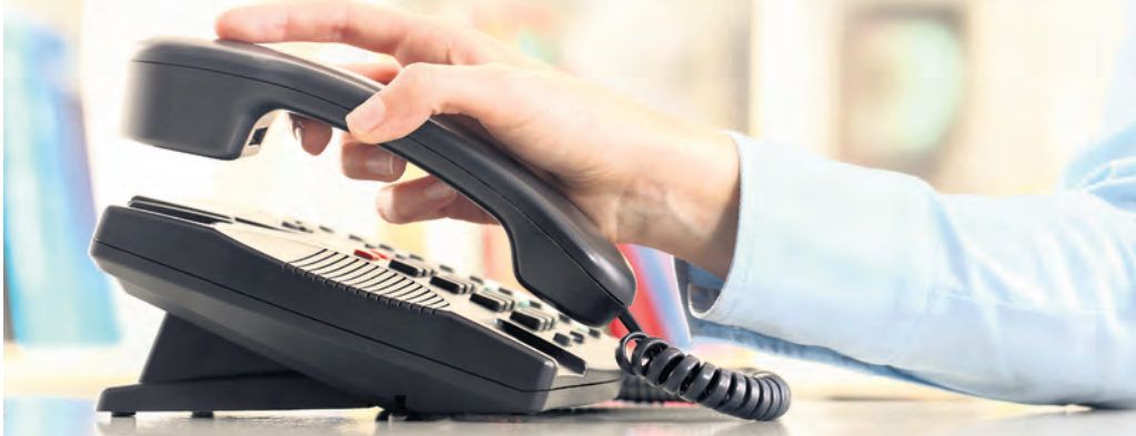
Spam-Anrufe mit angeblichen Gewinnen, penetranter Werbung oder automatischen Bandansagen bleiben für viele Menschen ein wiederkehrendes Ärgernis. Am besten sofort auflegen.

Eine Betroffene aus Bünde wandte sich an die Bundesnetzagentur. Zwar sind zehntausende Beschwerden wegen Rufnummernmissbrauch registriert, doch Spam-Anrufe und Betrug bleiben ein Problem.