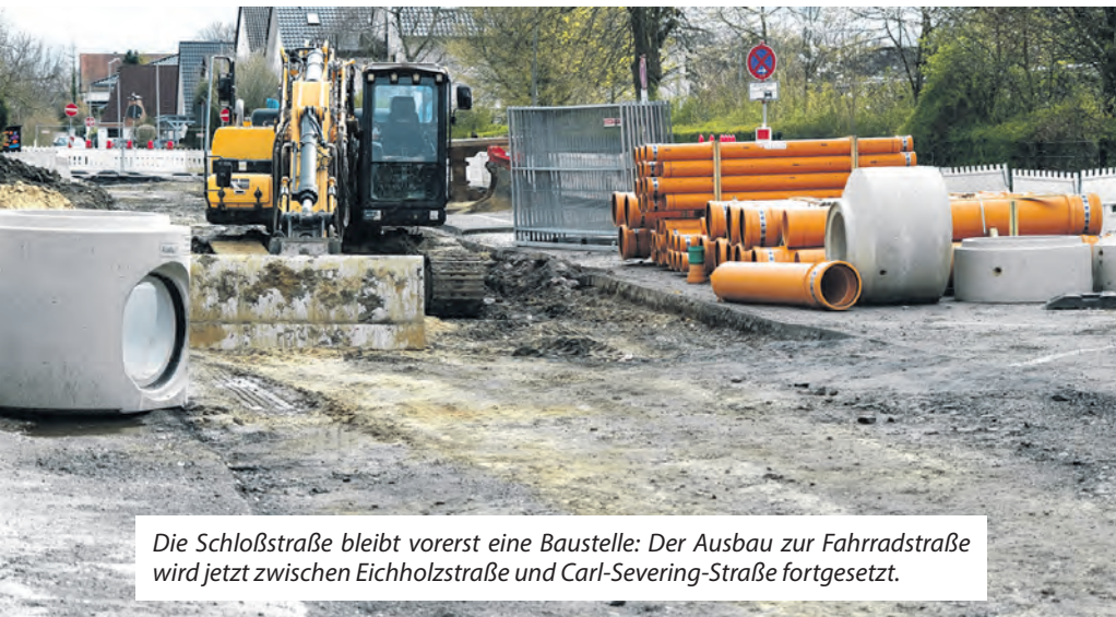
Die Schloßstraße bleibt vorerst eine Baustelle: Der Ausbau zur Fahrradstraße wird jetzt zwischen Eichholzstraße und Carl-Severing-Straße fortgesetzt.

Mit drei Monaten Verspätung ist die erste Hürde geschafft: Die Sanierung und der Ausbau der Schloßstraße zu einer Fahrradstraße zwischen Kurt-Schumacher-Straße und der Eichholzstraße ist vollendet. Inzwischen ist die Baustelle weitergezogen zum zweiten Bauabschnitt – zwischen Eichholzstraße und Carl-Severing-Straße wird bis mindestens Dezember kein Durchkommen sein.