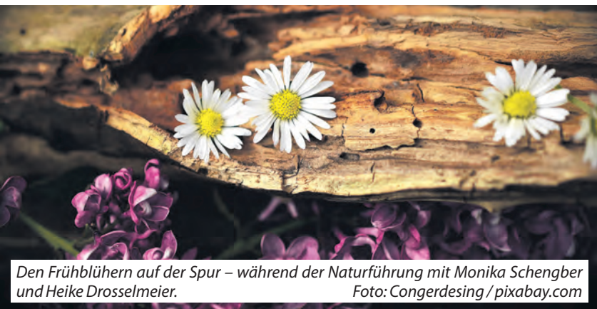
Den Frühblühern auf der Spur – während der Naturführung mit Monika Schengber und Heike Drosselmeier.

Unter dem Leitgedanken »Löwenzahn, Bärlauch und Gänseblümchen: Den Frühblühern auf der Spur!« steht eine Exkursion, die das Amt für Umwelt und Klimaschutz der Stadt Melle am Samstag, 18. April, im Rahmen der »Meller Naturführungen« veranstaltet. Die Tour beginnt um 14:30 Uhr auf dem Wanderparkplatz Schützenstraße/Lieth in Wellingholzhausen. Geleitet wird die Tour von Heike Drosselmeier und Monika Schengber.