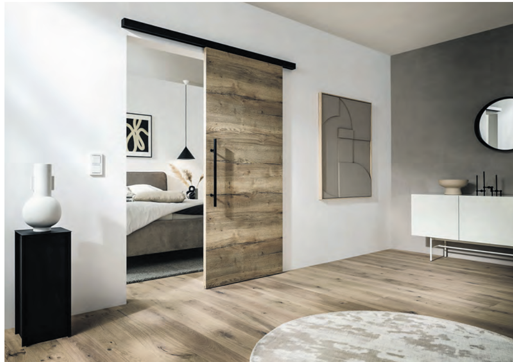
Schiebetüren nehmen nur wenig Platz in Anspruch und schaffen barrierefreie Durchgänge.

(DJD). Wer sich frischen Wind für das Zuhause wünscht, muss nicht gleich an eine Kernsanierung denken. Oft reichen schon wenige, dafür aber gezielte Renovierungen, um den eigenen vier Wänden ein neues Raumgefühl zu geben. Wo bisher sperrige Türblätter im Weg standen, können Schiebetüren eine Alternative sein, die Platz spart, mehr Durchgang schafft und Räume zugleich trennt und verbindet. Gerade in engen Wohnsituationen, in denen jeder Quadratmeter zählt, sind sie eine naheliegende Lösung. Doch ihr Reiz ist nicht nur praktischer Natur: Die leise auf Schienen gleitenden Türblätter werden selbst zum Gestaltungselement und lassen je nach Material mehr oder weniger natürliches Licht hindurch und verändern so die Wirkung eines Raumes. Aus großzügigen Lofts und dem Industrial Style sind sie nicht wegzudenken.