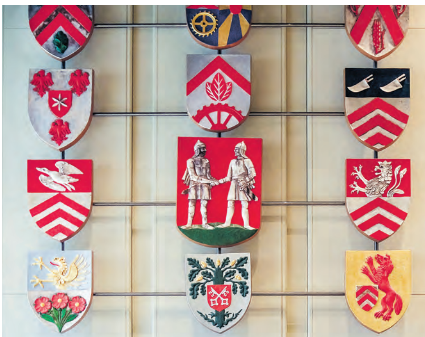
Der Bünde Ratssaal mit den Wappen aller Ortsteile: Die Ratsfraktionen haben sich jetzt einstimmig dafür ausgesprochen, dass das spontane Fragerecht der Bürger erhalten bleibt.

Dies kann aber eine Hürde für jene Menschen bedeuten – oft auch Ältere –, die am politischen Geschehen ihrer Heimatstadt teilhaben wollen. E-Mails oder schriftliche Fristen wirken für viele als Barriere. Diese Menschen dürfen