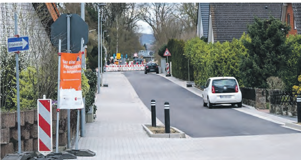
Der erste Abschnitt ist fertig: Die Fahrbahn zwischen Kurt-Schumacher-Straße und Eichholzstraße ist jetzt deutlich schmaler. Für Pkw gilt die neue Einbahnstraßenregelung.

len Schülern mit dem Fahrrad genutzt – letzteres soll ja so bleiben. „Für den oben genannten Bereich wird eine Vollsperrung eingerichtet. Die Umleitung erfolgt über die Eichholzstraße, Weseler Straße und Carl-Severing-Straße“, teilt die Stadt Bünde mit. Die Grundschüler können das Schulgebäude auch während der Bauphase sicher über die Schloßstraße erreichen, hierfür seien keine Umwege erforderlich. Die Kanalarbeiten am Waldstück an der Schloßstraße neben dem Sportplatz ruhen derzeit wegen der Saatkrähenkolonie. Die dicken Rohre dort künden aber davon, dass es hier demnächst weitergehen soll. Die Stadt Bünde, die im vergangenen Jahr die Schonzeit der Tiere missachtet und dafür sehr viel Kritik erfahren hatte, beteuert aber, dass dort bis zum Ende der Schonzeit nicht weiter gearbeitet werde.