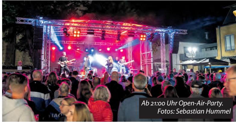
Ab 21:00 Uhr Open-Air-Party.