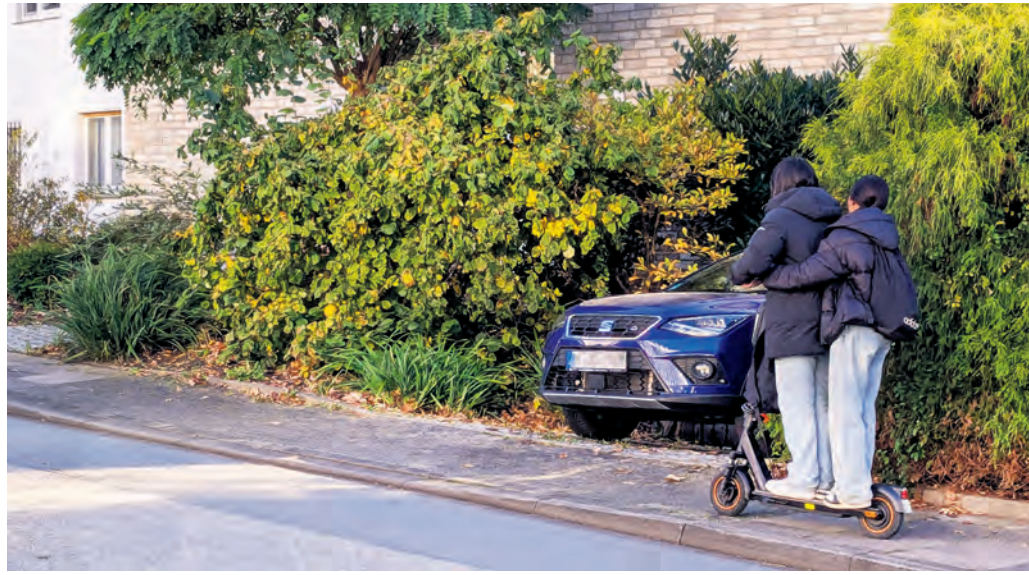
Leider ein alltäglicher Anblick auch im Kreis Herford: Zwei Jugendliche, die unerlaubt auf einem E-Roller fahren und sich und andere gefährden, indem sie die Verkehrsregeln missachten.

Die steigende Anzahl der Unfälle liegt auch an der zunehmenden Verbreitung dieser Gefährte. Allerdings scheinen das Fahrverhalten und die Einstellung zu Verkehrsregeln jeglicher Art sowie die Rücksicht im Straßenverkehr ein generelles Problem bei vielen E-Roller-Fahrern