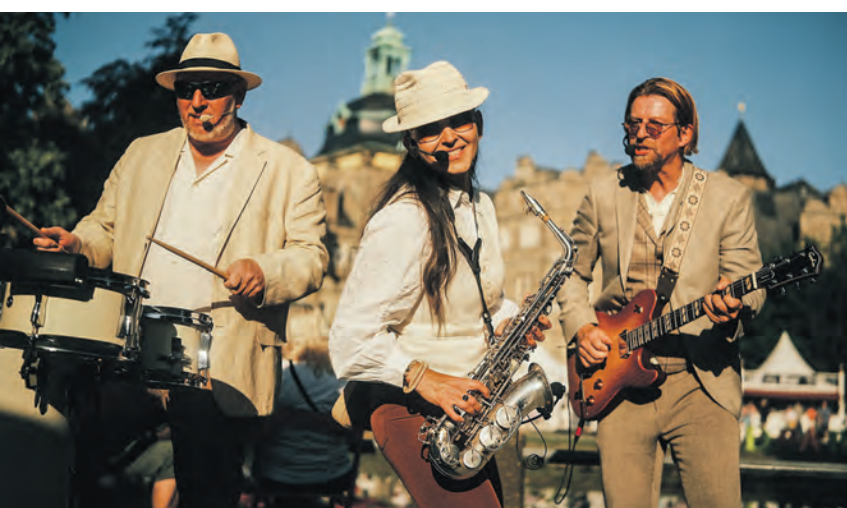
Für gute Unterhaltung sorgt am Abend die Band »Mr. Moonlight«.