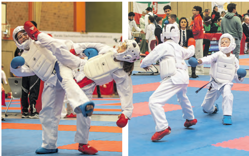
Kumite (oben) und Kata (unten)

Bünde wurde Mitte März zum Zentrum des Karate-Nachwuchses in Nordrhein-Westfalen. Bei der Landesmeisterschaft der Altersklassen U8 bis U14 in der Sporthalle des Erich-Gutenberg-Berufskollegs zeigte sich eindrucksvoll die Dynamik des Kinder- und Jugendsports. Mehr als 500 Zuschauerinnen und Zuschauer verfolgten die Wettkämpfe und sorgten auf den Rängen für eine lebhaft und zugleich wertschätzende Atmosphäre.