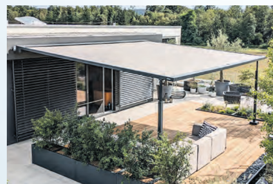
Die neue Pergolamarkise „pergola style“ von markilux ist bei Fach- und Endkunden mit ihrem grazilen Design gut angekommen. Besonderen Anklang fand vor allem das vielfältige Lichtsystem mit der Option, zwischen warmweißem und farbigem Licht wechseln zu können.