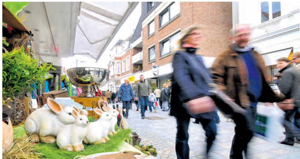
Ein gutes Ostergeschäft könnten die Einzelhändler im Kreis Herford dringend brauchen: Derzeit belastet die anhaltende Kaufzurückhaltung die Umsätze der Läden massiv.

Viele Herausforderungen, geopolitische Unsicherheiten, deutliche Unterschiede zwischen den Branchen und eine Mut machende Tendenz: Das sind einige der Ergebnisse der jüngsten IHK-Konjunkturumfrage unter 268 Betrieben und Unternehmen im Kreis Herford.