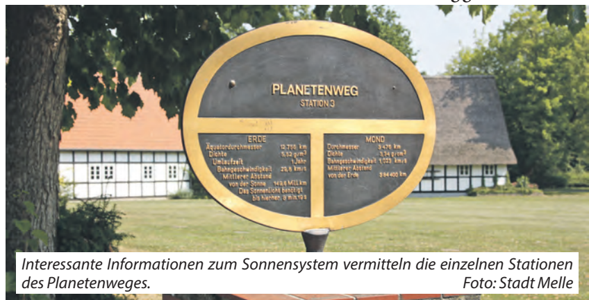
Interessante Informationen zum Sonnensystem vermitteln die einzelnen Stationen des Planetenweges.

Am Sonntag, 19. April, startet auf dem Planetenweg eine spannende Fahrradtour: Natur- und Weltraumfans können dabei im Rahmen der »Meller Naturführungen« gemeinsam die Geheimnisse unseres Sonnensystems erkunden – und gleichzeitig die Schönheit der heimischen Natur hautnah erleben. Der Start erfolgt um 10 Uhr an der Sonnen-Station an der Ecke Grönenberger Straße / Friedrich-Ludwig-Jahn-Straße in Melle-Mitte. Die Tour wird von Bernd Zeiß fachkundig geleitet.