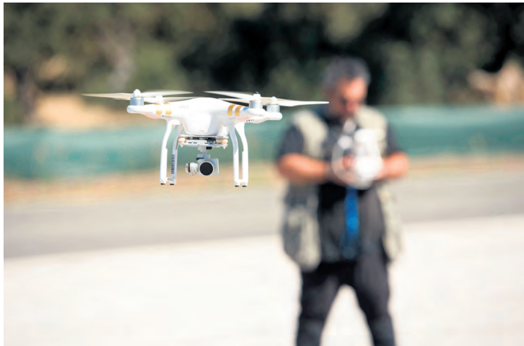
Umstritten: Wie bei so vielen technischen Neuerungen kann auch mit einer Drohne viel Missbrauch betrieben werden. Seitdem diese Fluggeräte günstig zu haben sind, wird Gaffen aus der Luft zum Problem.

Während die Rettungskräfte um das Leben der im Autowrack eingeklemmten Frau kämpften und den verletzten Busfahrer versorgten, ließ ein Anwohner eine Drohne über der Unfallstelle kreisen. Ein derart pietätloses und gefährliches Verhalten macht sprachlos. Das Fluggerät irritierte die Einsatzkräfte und hätte auch den Rettungshub-